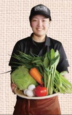
オオバ THE レインボー 780円

鉄板焼き&焼きそば&一品料理が 充実したお店になり お得な宴会コースをご用意しています。 低温熱成焼きで じっくり仕上げるお好み焼きは 外はカリッ、中はふわっふわの新食感。 サイズもコンパクトになり 他のお料理やお酒を楽しんだ後でも 美味しくいただけます。 深夜3時まで、元気に営業中!! ぜひお楽しみください。